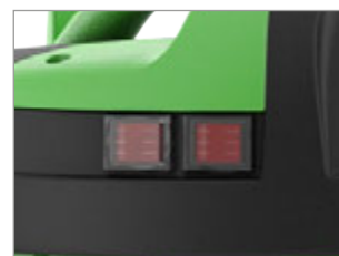
INTERRUPTORES CON INDICADORES LUMINOSOS