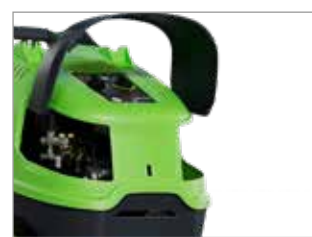
FACILE ACCESSO PER LA MANUTENZIONE