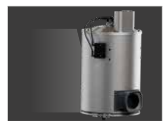
LA CALDAIA PUÒ ESSERE APERTA DALL'ALTO PER UNA FACILE PULIZIA