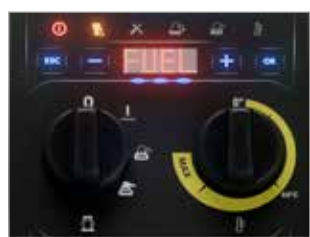
PANNELLO DI CONTROLLO CON SPIE DI SEGNALAZIONE E DISPLAY