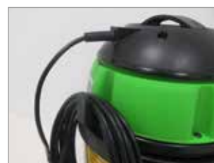
GANCIO AVVOLGICAVO INTEGRATO ALLA TESTATA