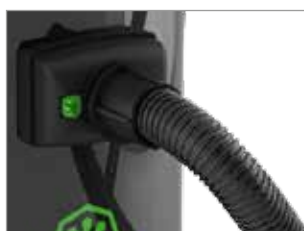
TUBO FLESSIBILE BLOCCATO IN MODO SICURO E AFFIDABILE