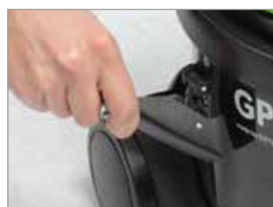
GANCI ESTREMAMENTE FLESSIBILI