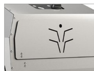
BASTA APRIRE LO SPORTELLLO FRONTALE E SI PUÒ ACCEDERE ALLA TANICA ANTICALCARE