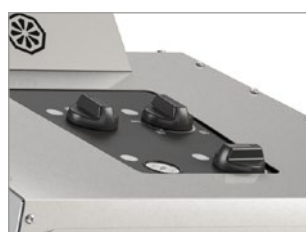
PANNELLO DI CONTROLLO CON INDICATORI LUCI LED, INDICANO E SEGNALANO EVENTUALI ANOMALIE DELLA MACCHINA