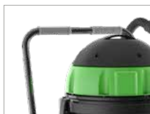
CARRELLO CON MANIGLIA