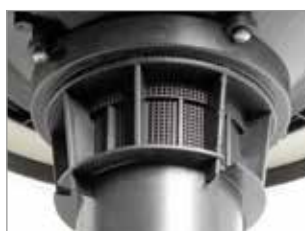
GUARNIZIONE INNOVATIVA DELLA TESTATA