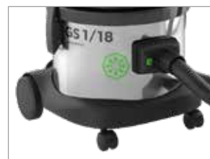
CARRELLO CON DUE RUOTE ANTERIORI GIREVOLI E DUE GRANDI RUOTE PORTERIORI