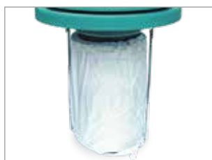
CARTUCCIA HEPA H14 CON PREFILTRO IN POLICARBON