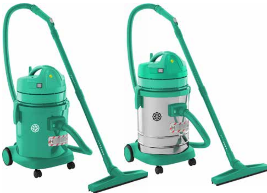
GP 1/27 HEPA ISO5