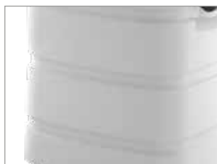
FUSTO IN PLASTICA ANTI-URTO