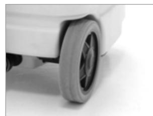
RUOTE CON COPERTURA IN GOMMA