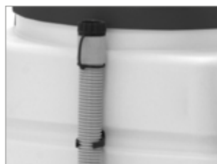
TUBO DI SCARICO