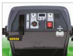
PANNELLO DI CONTROLLO INTUITIVO