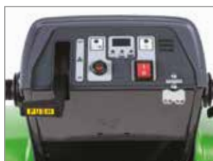
PANNELLO DI CONTROLLO INTUITIVO