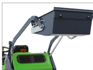
SISTEMA DI SCARICO CON PISTONE IDRAULICO