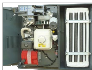
FILTRO IN TESSUTO