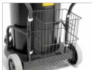
PORTACCESORIOS INDUSTRIAL OPCIONAL