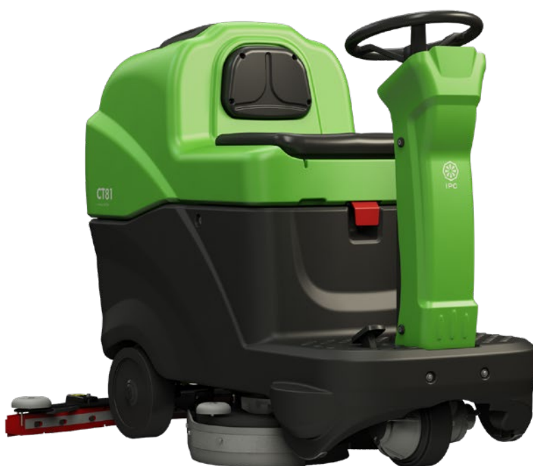
VERSIÓN CON UN CEPILLO