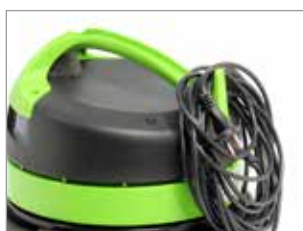
GANCHO PARA CABLE