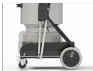
CARRELLO CON ALTEZZA REGOLABILE