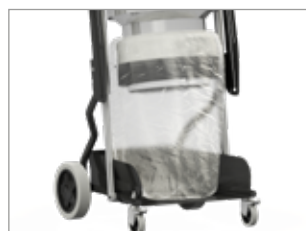
SISTEMA DI RACCOLTA LONGOPAC®