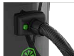
TUBO FLESSIBILE BLOCCATO IN MODO SICURO E AFFIDABILE