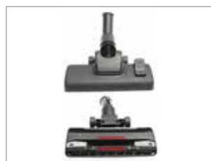
NUEVA BOQUILLA CON ALTA EFICACIA DE LIMPIEZA.