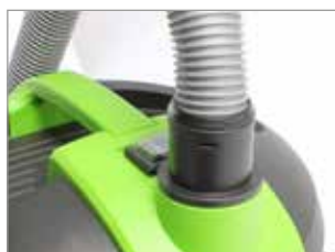
DISPOSITIVO DE SOPLADO