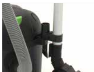
CLIP PORTA ACCESORIOS