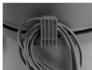
GANCHO PARA CABLE