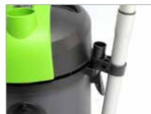
CLIP PORTA ACCESORIOS