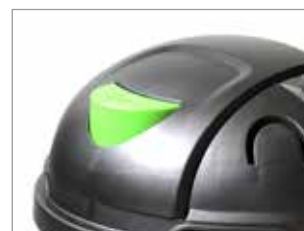
INTERRUPTOR DE ENCENDIDO / APAGADO ACCIONADO FACILMENTE CON EL PIE."