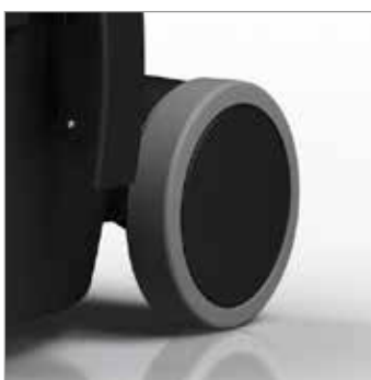
Ruedas con goma anti-marcas