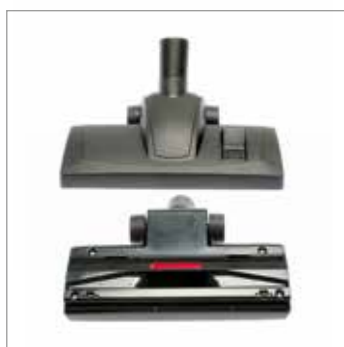
Nueva boquilla para limpieza más eficaz