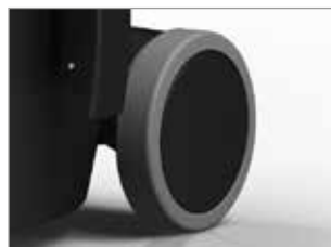
RUEDAS CON BANDA DE GOMA