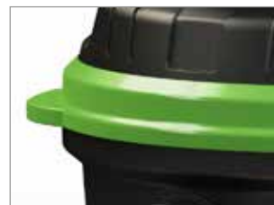
PROTECCIÓN LATERAL PARA PUERTAS Y PAREDES