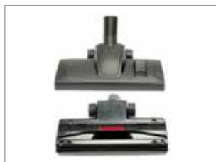
NUEVA BOQUILLA CON ALTA EFICACIA DE LIMPIEZA