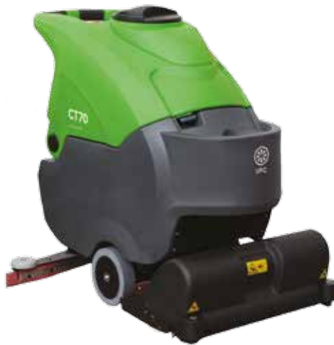
CT 70 BT 55 ROLLER