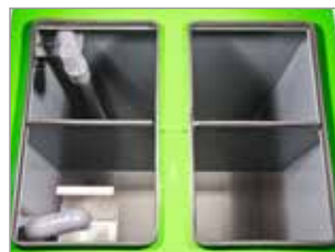
DEPÓSITO CON TAPA GRANDE. FÁCIL LIMPIEZA