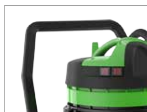
WAGEN MIT GRIFF