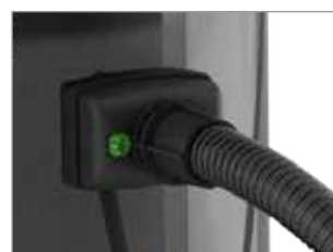
DER FLEXIBLE SCHLAUCH IST FEST UND VERLÄSSLICH VERANKERT