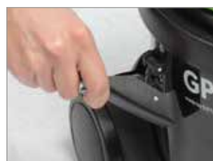
SEHR FLEXIBLE HAKEN