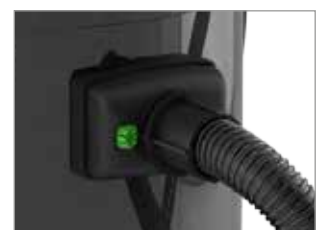
DER FLEXIBLE SCHLAUCH IST FEST UND VERLÄSSLICH VERANKERT